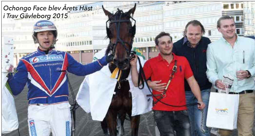
Ochongo Face blev Årets Häst i Trav Gävleborg 2015